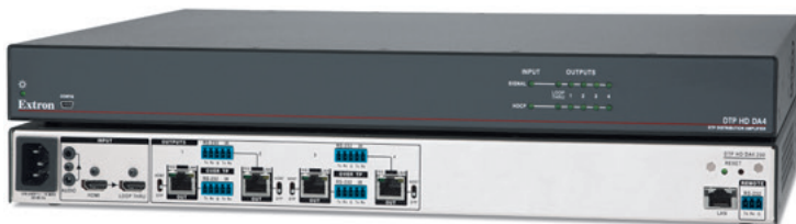
DTP HD DA4 4K 230