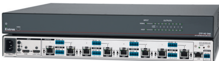
DTP HD DA8 4K 230

Extron DTP HD DA4 4K 230 和 DTP HD DA8 4K 230 可将信号延长并分配至 4 个或 8 个具有 Extron DTP™ 功能的产品，并通过 CATx 屏蔽电缆将 HDMI、音频和控制信号传送至 70 m (230') 远的距离。这两款符合 HDCP 标准的 DTP 分配放大器包括许多便于集成的特性，能够简化集成，可将一路 HDMI 源信号可靠地分配至 DTP Systems 内的多个终端。